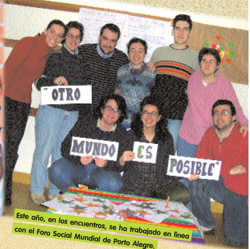
Todos los integrantes del grupo comparten una vocación común: vivir su ser cristiano.